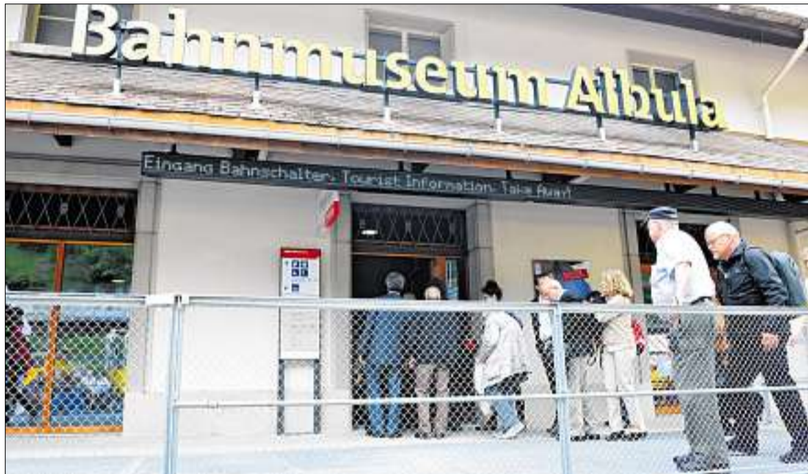
Ein grosser Moment für die RhB und für Bergün: Die ersten (geladenen) Gäste betreten das neu eröffnete Bahnmuseum Albula, heute und morgen steigt das grosse Eröffnungsfest.