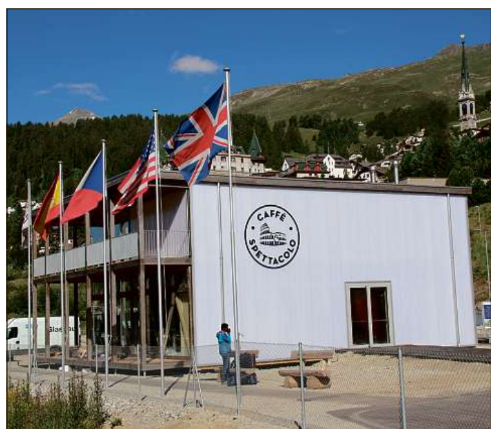
Simpel e tuttina modern ed adattà a la cuntrada: il «Quadrin» e Café Bistro «Spettacolo».

Igl ei in fatg che la halla resta savens vita entochen ch'ella vegn buca administrada endretg.