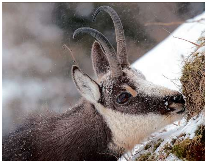
Ina dalle bellezia fotografias d'Ervin Monn.